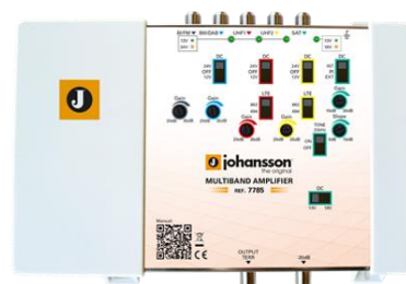
Ref. 7785 5 inputs: BI/FM, BIII/DAB, UHF1, UHF2, SAT